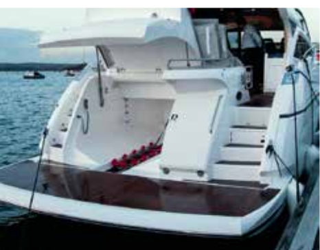
Гараж для тендера вмещает Williams 325, а купальная платформа на гидравлике входит в стандартную комплектацию.