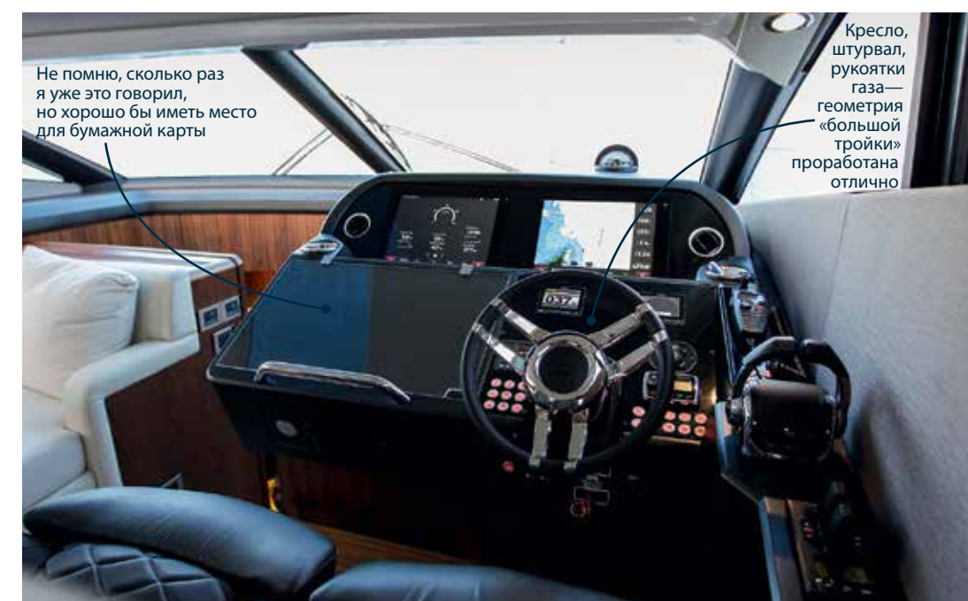
Не помню, сколько раз я уже это говорил, но хорошо бы иметь место для бумажной карты